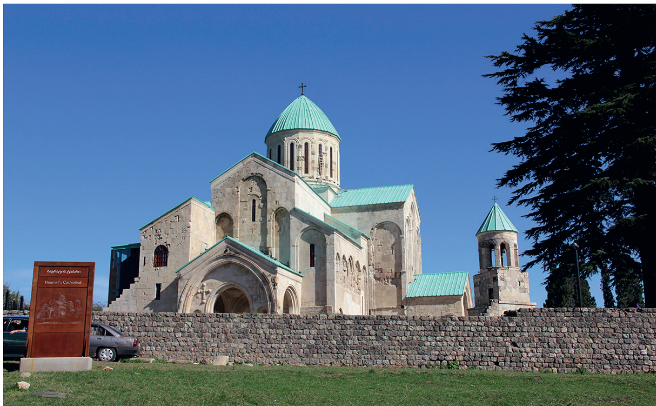
3. ბაგრატის კათედრალი 1003. KUTAISI, BAGRATI CATHEDRAL - 1003.