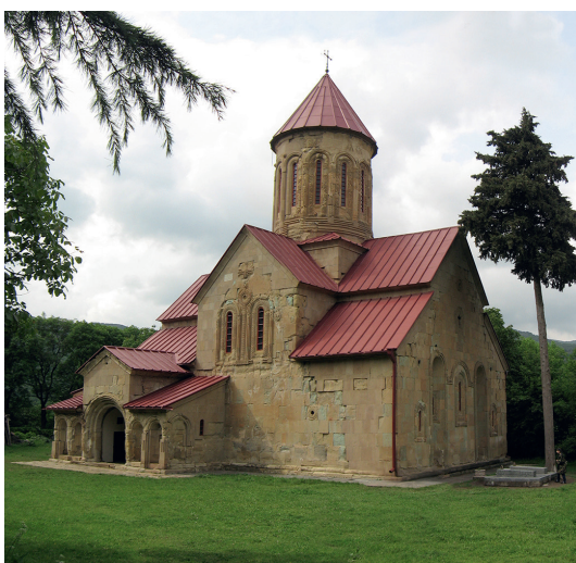
4. ბეთანია - XII-XIII სს. BETHANIA - XII-XIII CENTURIES.