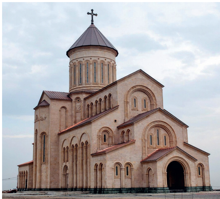
6. ა) თბილისი, წმინდა სამების საკათედრო ტაძარი - 1996-2004; ბ) თბილისი, ივერიის ღვთისმშობლის ხატის სახ. ტაძარი - 2012-2017. A) TBILISI, HOLY TRINITY CATHEDRAL - 1996-2004; B) TBILISI, THE CATHEDRAL OF PANAGIA PORTAITISSA OF IBERIA TEMPLE - 2012-2017;