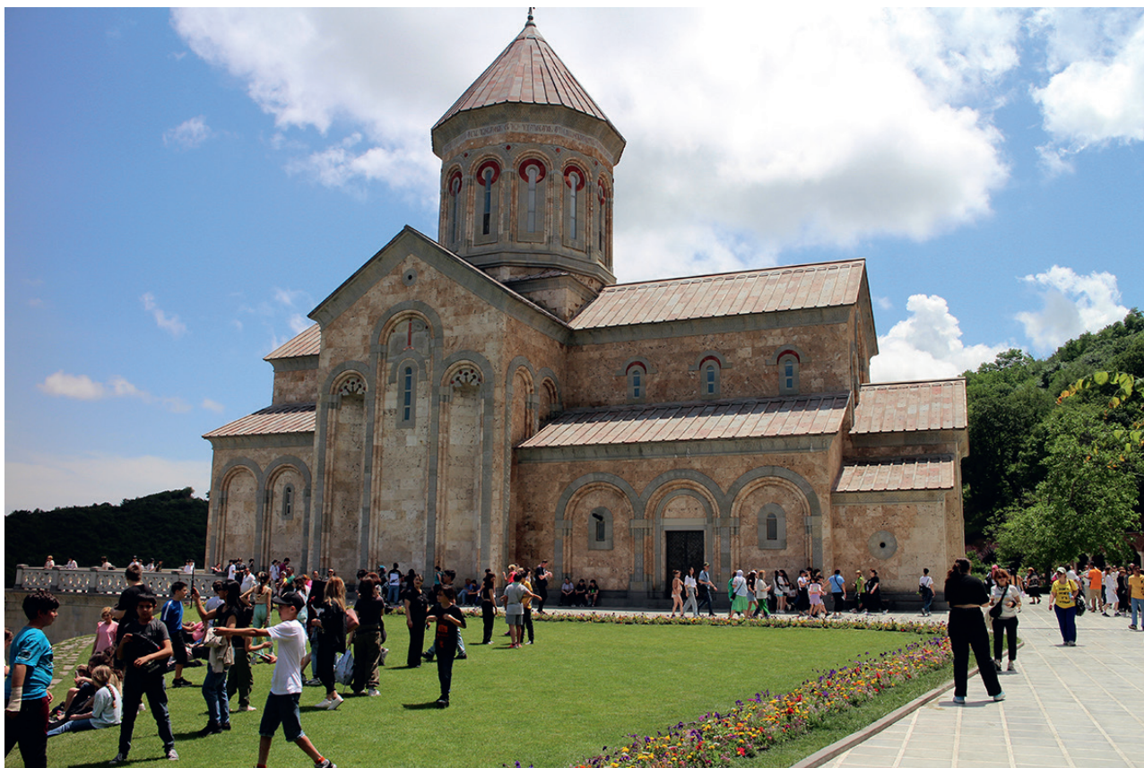
7. ბოდბე, წმინდა ნინოს სახელობის საკათედრო ტაძარი - 2009-2019. BODBE, SAINT NINO CATHEDRAL - 2009-2019.