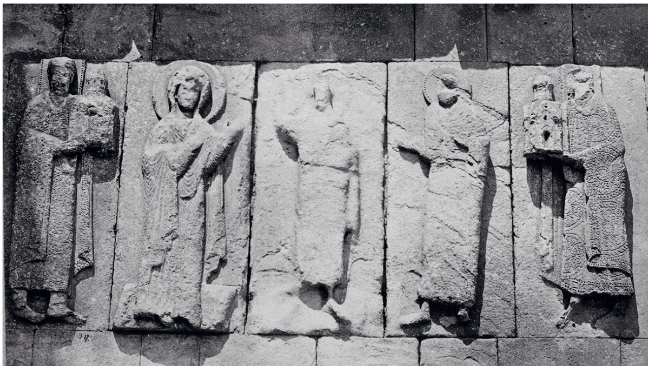
1. ოშკი, დეისუსის კომპოზიციის მხედრების თანხლებით (Xს.) (ფოტო - დ. ერმაკოვი). OSHKI, DEISIS COMPOSITION ACCOMPANIED BY DONATORS- (XC.); (PHOTO - D. ERMAKOV)