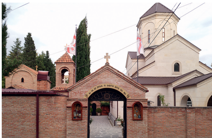
5. თბილისი, წმინდა ნინოს სახელობის და სულთმოფენობის სახელობის ეკლესიები (ვაჟა-ფშაველას გამზ. № 51ა.) TBILISI, SAINT NINO AND PENTECOST CHURCHES (VAZHA-PHAVELA AVE. NO. 51A)