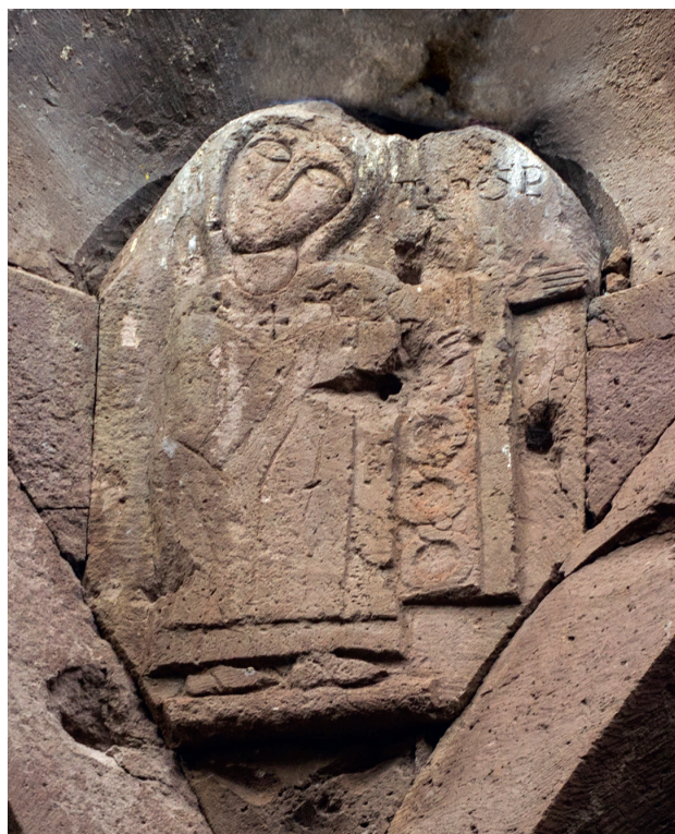
2. კუმურდოს კათედრალის მხედრების რელიეფური მანდაკებები (Xს.). RELIEF SCULPTURES OF THE DONATORS OF KUMURDO CATHEDRAL -(XC.).