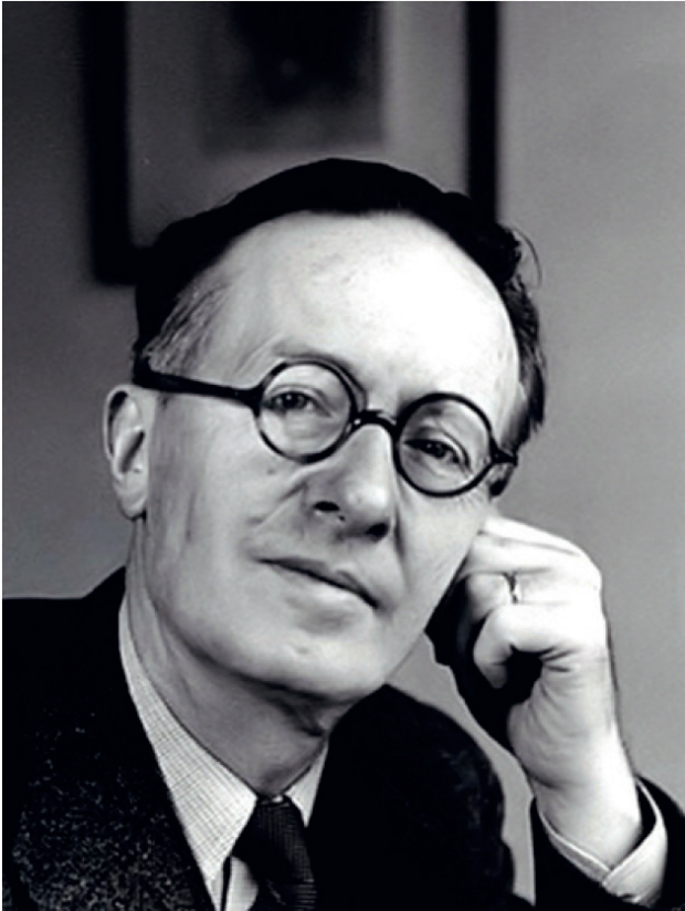
1. ჯან შიროდუ (1882-1944) JEAN GIRAUDOUX (1882-1944)