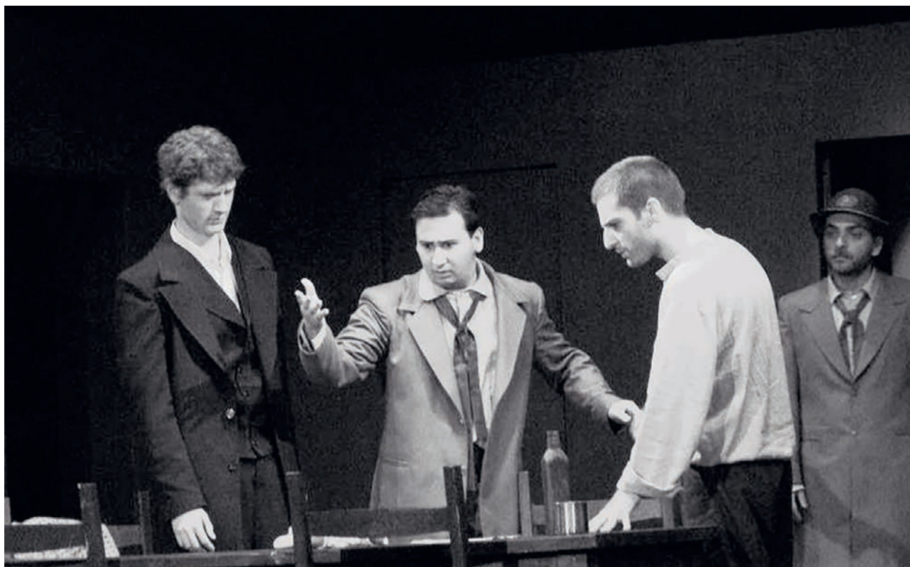
2. სცენა სკვეტაკლიდან — ართურ მილერის „საილემის პროცესი“, რეჟ. თემურ ჩხეიძე, მაია დობორჯინიძე, თეატრისა და კინოს უნივერსიტეტის სასწავლო თეატრი, 2022. A SCENE FROM THE PLAY “THE SALEM PROCESS” BY ARTHUR MILLER, DIR. TEMUR CHKHEIDZE, MAYA DOBORJGINIDZE, THEATRE AND CINEMA UNIVERSITY TRAINING THEATRE, 2022.