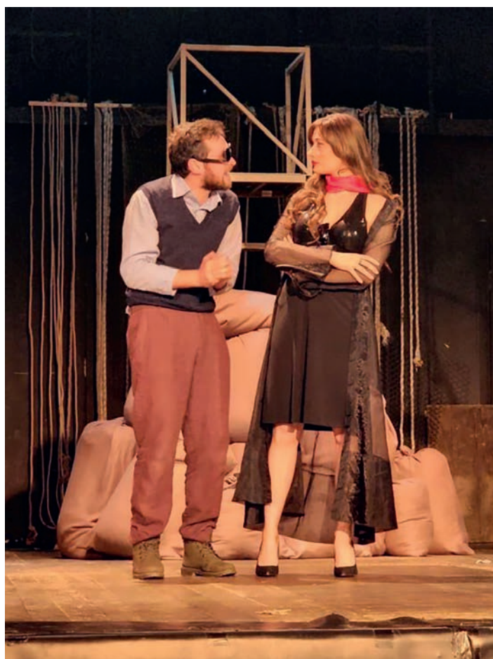
4. სცენა სპექტაკლიდან – ედუარდო დე ფილიპოს „შიში ნომერი ერთი“, რეჟ. ნანუკა (ნანა) ხუსკივაძე, თეატრისა და კინოს უნივერსიტეტის სასწავლო თეატრი, 2021. A SCENE FROM THE PLAY “FEAR NUMBER ONE” BY EDUARDO DE FILIPPO, DIR. NANUKA (NANA) KHUSKIVADZE, THEATRE AND CINEMA UNIVERSITY TRAINING THEATRE, 2021.