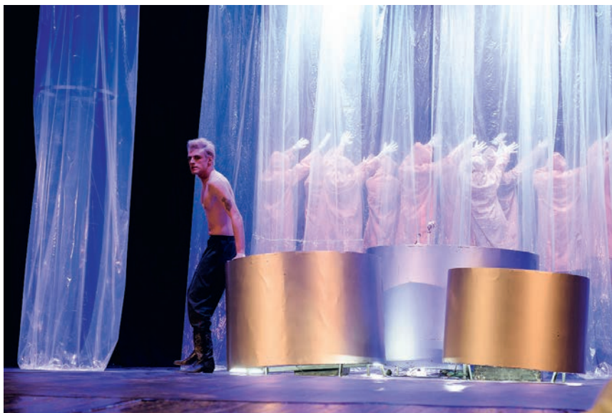
1. სცენა სკვეტაკლიდან — კარლ ჩაპეკის „თეთრი შავი“, რეჟ. სოსო ნემსაძე, თეატრისა და კინოს უნივერსიტეტის სასწავლო თეატრი, 2021. A SCENE FROM THE PLAY “THE WHITE PLAGUE” BY KARL CHAPEK, DIRECTED BY SOSO NEMSADZE, THEATRE AND CINEMA UNIVERSITY TRAINING THEATRE, 2021.