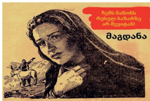
4. მემი - „მაგდანა: „ჩემს მანონს რუსულ ბაზარზე არ შევიტან“. MEME - “MAGDANA: I WILL NOT SELL MY MATSONI ON RUSSIAN MARKET”