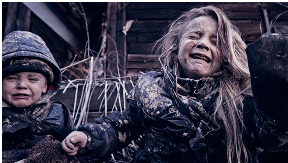
1. ფოტო tsargrad.tv-ს ვებპლატფორმიდან, რომელიც დართული აქვს პუბლიკაციას - „რუსები თავისიანებს არც იოვებენ! დახმარების დროა“. PHOTO FROM THE ARTICLE PUBLISHED ON TSARGRAD.TV WEB PLATFORM “RUSSIANS NEVER LEAVE THEIR OWN BEHIND! TIME TO HELP!”