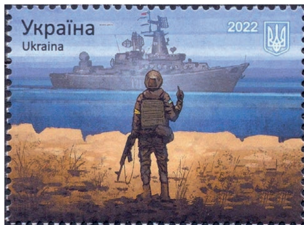
2. უკრაინული საფოსტო მარკა. UKRAINIAN POSTAL MARK