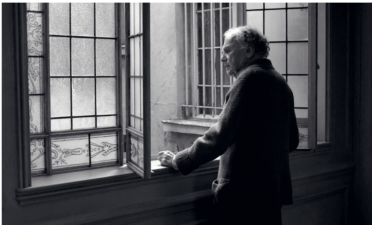
3-4 კადრი ფილმიდან „სიყვარული“ რეჟისორი: მიხაელ ჰანეკე, 2012. FOOTAGE FROM THE FILM «LOVE» DIRECTED BY MICHAEL HANEKE, 2012.