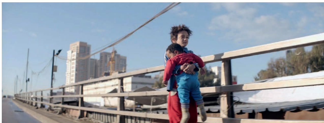
5-6 კადრი ფილმიდან „კაპერნაუმი“ რეჟისორი ნადინ ლაბაკი, 2018. FOOTAGE FROM THE FILM «CAPERNAUM» DIRECTED BY NADINE LABAKI 2018.