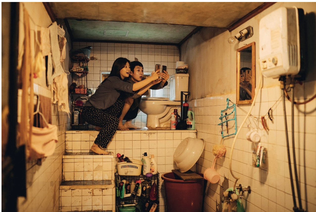
1-2 კადრი ფილმიდან „პარაზიტები“ რეჟისორი: ჯონ პო ბონ, 2019. FOOTAGE FROM THE FILM «PARASITES» DIRECTED BY JOHN POE BON. 2019.