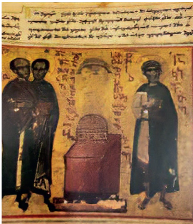
3. წმიდა კოზმა და წმიდა დამიანო. ქართულ-ბერძნული კრებული. XV ს. SAINT COSMAS AND SAINT DAMIAN, GEORGIAN-GREEK MANUSCRIPT. XV CENTURY