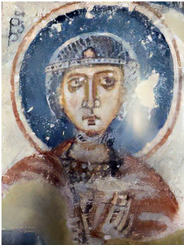
1. წმიდა ბარბარე. ლაღამის მაცხოვრის ქვედა ეკლესია. XI ს. დასაწყისი SAINT BARBARE. LOWER CHURCH OF LAGHAMI SAVIOR. BEGINNING OF XI CENTURY