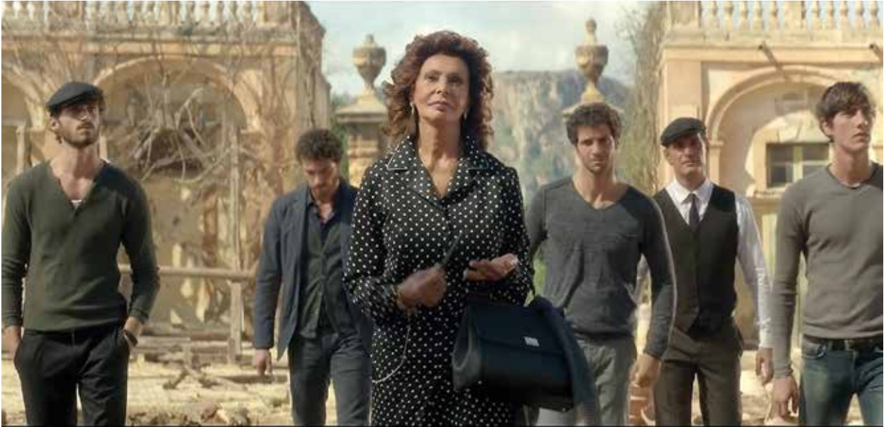
4. კადრი ფილმიდან Dolce Rosa Excelsa , რეჟისორი ჯუზეპე ტორნატორე, 2016. SCENE FROM THE FILM DOLCE ROSA EXCELSA , DIRECTED BY GIUSEPPE TORNATORE, 2016.