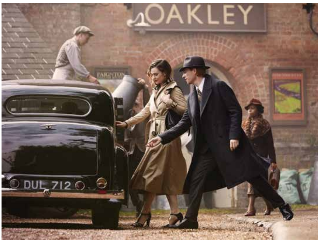
7. კადრი ფილმიდან „ტომას ბერბერის ისტორია“, რეჟისორი აშიფ კაპადია. 2016. SCENE FROM THE FILM THE TALE OF THOMAS BURBERRY , DIRECTED BY ASIF KAPADIA, 2016.