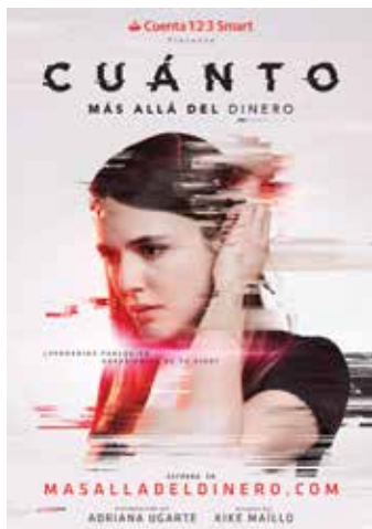
2. კადრი ფილმიდან „ფულის მიღმა“, სააგენტო: MRM// MCCANN MADRID. 2017. SCENE FROM THE FILM BEYOND MONEY , AGENCY: MRM// MCCANN MADRID. 2017.