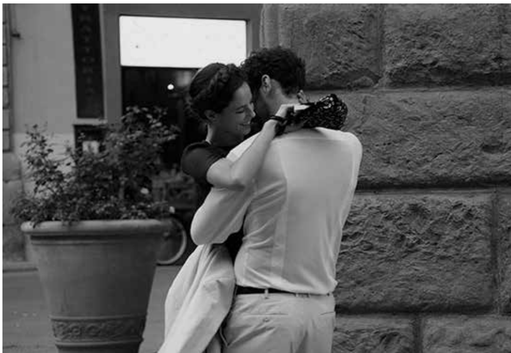
6. კადრი ფილმიდან „მოსიარულე ისტორიები“, რეჟისორი ლუკა გუადანიტო. 2013. SCENE FROM THE FILM WALKING STORIES , DIRECTED BY LUCA GUADAGNINO, 2013.