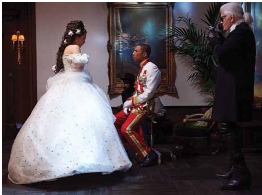
3. კადრი ფილმიდან „რეინკარნაცია“, რეჟისორი კარლ ლაგერფელდი. 2014. SCENE FROM THE FILM REINCARNATION , DIRECTED BY KARL LAGERFELD, 2014.