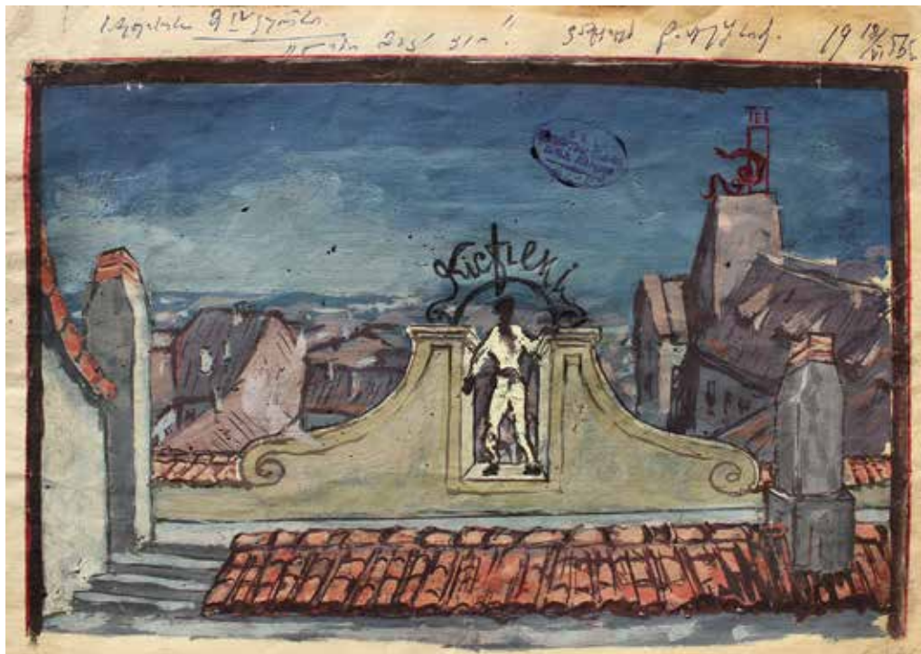
2. დ. თავაძე, ჟან-პოლ სარტრი, „ლიზი მაკკეი“, დეკორაციის ესკიზი, ძ. აბვ., 29X40,5. 1956 D. TAVADZE . JEAN-PAUL SARTRE “LIZZIE MACKAY”, STAGE DESIGN, PAPER, WATER-COLOR, 29X240,5. 1956