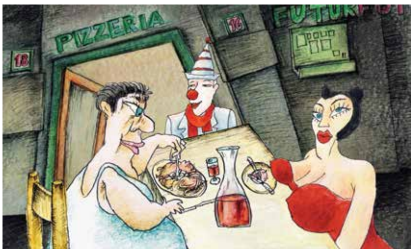
6. კადრი ფილმიდან „ფელინიჩიტა“, რეჟისორი ანდრეი ცვეტკოვი, 2009. A SCENE FROM THE FILM ‘FELLINICITA’. DIRECTED BY: ANDREY TSVETKOV. 2009.