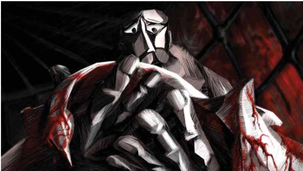
7. კადრი ფილმიდან „შუქურა“, რეჟისორი ველისლავა გოსპოდინოვა, 2009. A SCENE FROM THE FILM 'THE LIGHTHOUSE'. DIRECTED BY: VELISLAVA GOSPODINOVA. 2009.