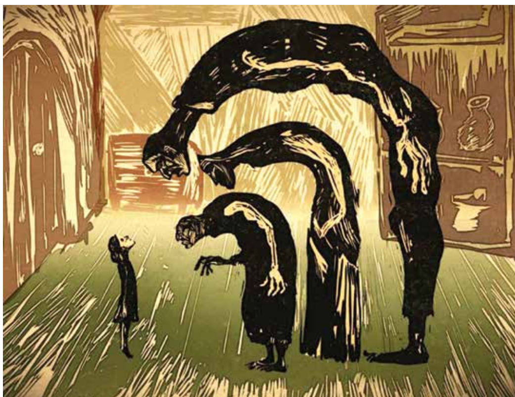
8. კადრი ფილმიდან „ბრმა ვაიშა“, რეჟისორი თეოდორ უშევი, 2016. A SCENE FROM THE FILM 'BLIND VAYSHA'. DIRECTED BY: THEODORE USHEV. 2016