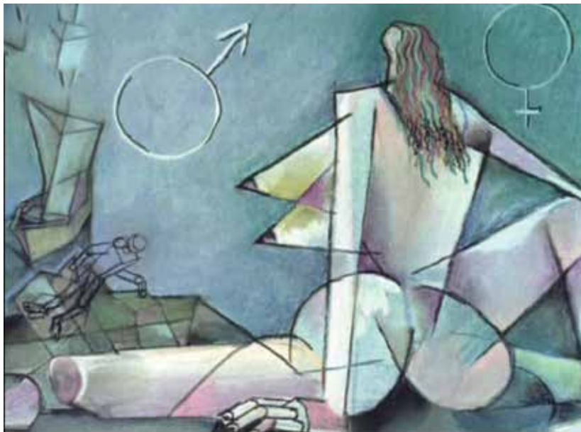
4. კადრი ფილმიდან „გერმი, კვირა“, რეჟისორები ანრი კულევი და ნიკოლაი თოდოროვი, 1980. A SCENE FROM THE FILM ‘SUNDAY’. DIRECTED BY: ANRI KOLEV AND NIKOLAY TODOROV. 1980.