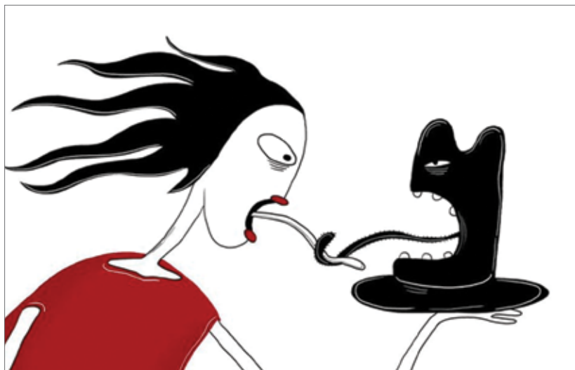
5. კადრი ფილმიდან „ანა ბლუმი“, რეჟისორი ვესელა დანჩევა, 2009. A SCENE FROM THE FILM ‘ANNA BLUME’. DIRECTED BY: VESSELA DANTCHEVA. 2009.