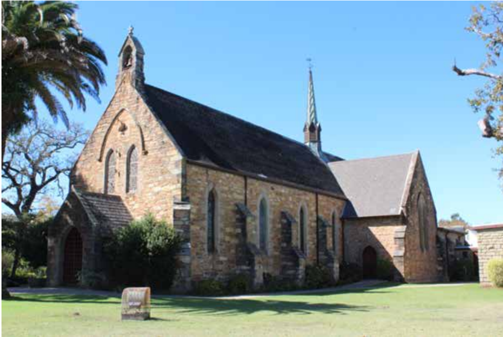
1. ჰორჰი (სამხრეთ აფრიკა), წმ. მარკოზის ანგლიკანური კათედრალი, სოფი გრეი. აშენებულია 1849-59 წწ. განივი ნაწილი დაემატა 1934 და 1954 წლებში. GEORGE (SOUTH AFRICA), ST. MARK'S ANGLICAN CATHEDRAL, SOPHY GRAY, BUILT 1849-50. THE TRANSEPTS WERE ADDED IN 1934 AND 1954. Stmarksgeorge, CC BY-SA 4.0 < https://creativecommons.org/licenses/by-sa/4.0/ >, via Wikimedia Commons. 2017