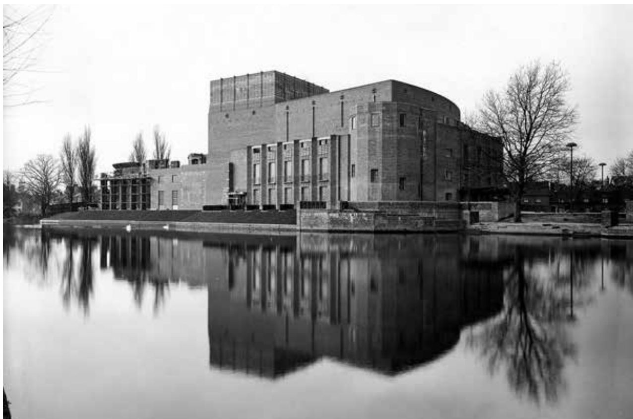
4. შექსპირის ისტორიული თეატრი სტრატფორდში, ელიზაბეთ სკოტი. CHESTERTON & SHEPHERD. 1932 წ. STRATFORD-UPON-AVON, SHAKESPEARE MEMORIAL THEATRE, ELISABETH SCOTT, CHESTERTON & SHEPHERD. 1932. ( http://theshakespeareblog.com/2018/02/women-and-suffrage-in-shakespeares-stratford/ ), probably copyright RIBA

fig. taken from Leonhard Helten, Architektur. Eine Einführung. Berlin 2009, S. 15. After Hellmann, Architecture for Beginners, 1984.