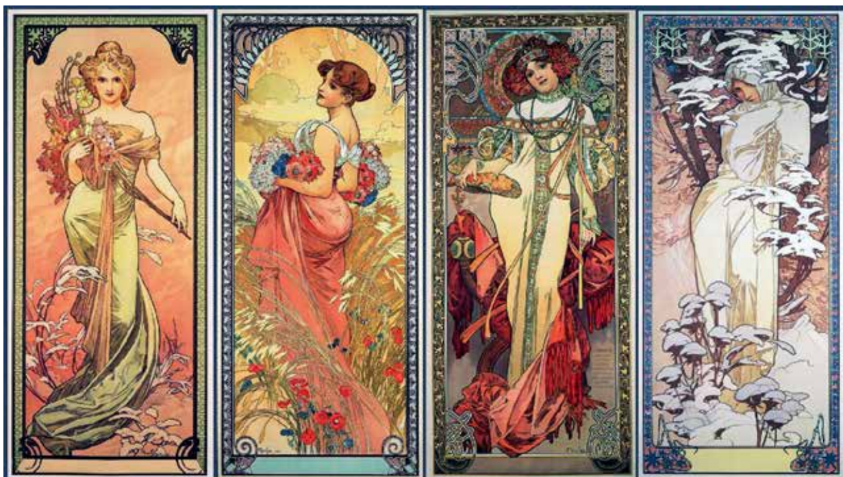
5. ა. მუხა, „წელიწადის დროები“. 1896 A. MUCHA. "SEASONS". 1896