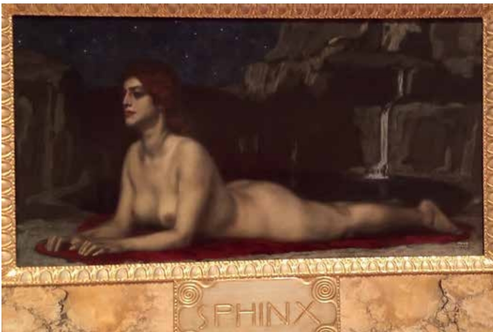
3. ფ. შტუკი, „სფინქსი“. 1904 F. STUCK. "SPHINX". 1904