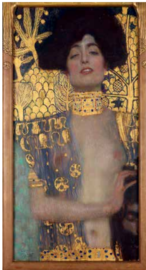
4. ბ. კლიმტი, „ივდიტი“. 1901 G. KLIMT. "JUDITH". 1901