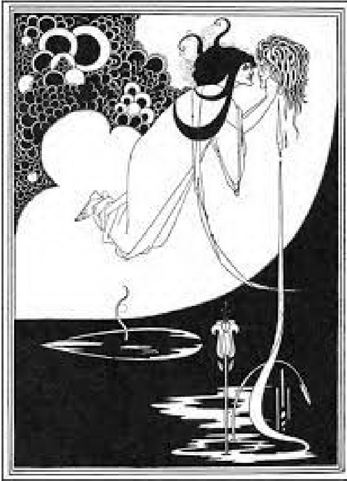
2. ო. ბერდსლი, „სალომე“. 1893 A. BEARDSLEY "SALOME". 1893